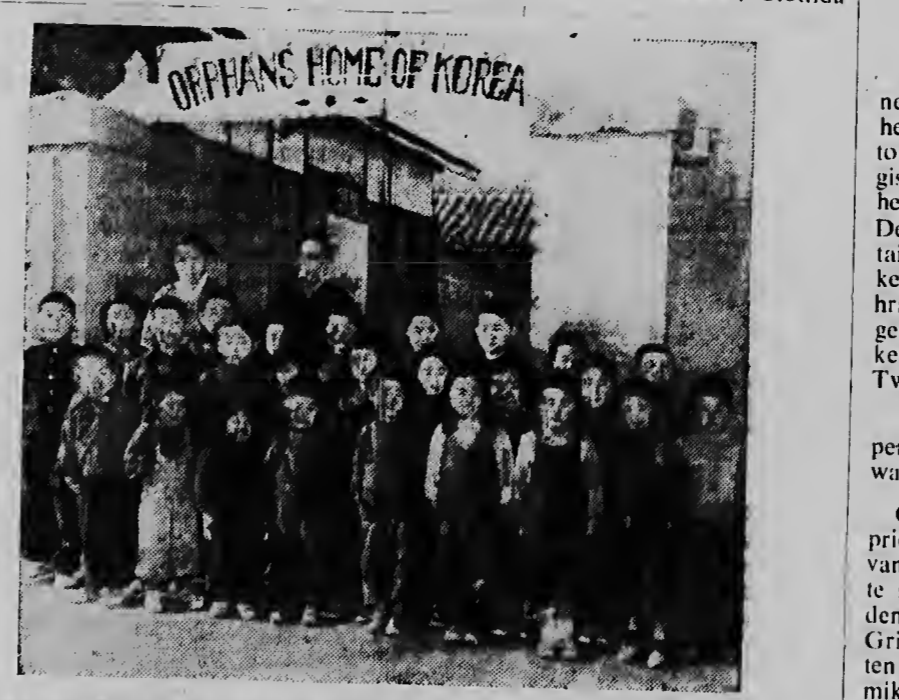
Een groep Zuidkoreaanse weeskinderen (boven) zal een rol krijgen in een Amerikaanse speelfilm, welke geheel in Korea zal worden opgenomen.